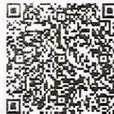
Sello Digital del CFDI